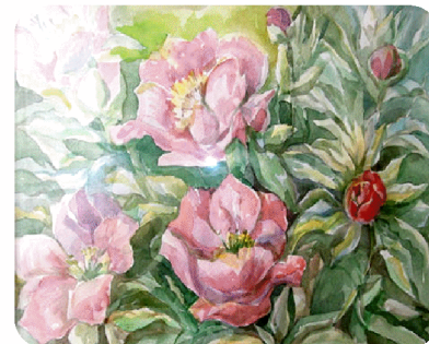
«Пионы», 2010 г.

Стихотворения Ларисы Владимировны серьёзны и до боли чувственны. Её поэзия – это не обычный девичий лирический дневник, а зрелые, осмысленные, прочувствованные вещи.