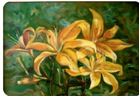
«Жёлтые лилии», 2009 г.