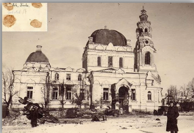
Благовещенский храм в Смоленской области без крестов. Фото 1941 года.

Всего же за годы войны в фонд обороны страны верующими было направлено 300 миллионов рублей. На эти деньги были построены и переданы в действующую армию 40 Т-34 танковой колонны «Димитрий Донской», а также истребительная эскадрилья «Александр Невский». Если учесть, что к началу Великой Отечественной войны Русская Православная Церковь в СССР была почти разгромлена, это можно назвать поистине чудом.