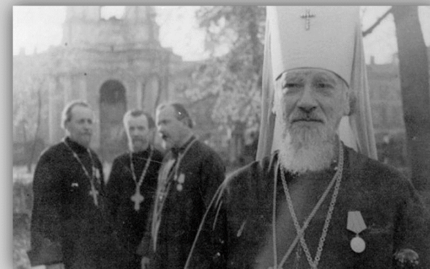
Священнослужители Русской Православной Церкви, награжденные медалью «За оборону Ленинграда».

Представители Церкви сполна разделяли со своим народом все тяготы и ужасы войны. Так, будущий Патриарх, митрополит Ленинградский и Новгородский Алексей (Симанский), который оставался в городе на Неве весь страшный период блокады, проповедовал, ободрял, утешал верующих, причащал и служил зачастую один, без диакона.