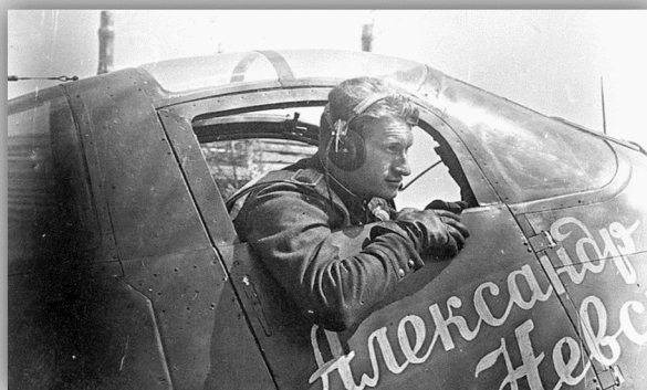
Танки и самолеты от Православной церкви

В годы Великой Отечественной войны Русская Православная Церковь, несмотря на многолетние довоенные репрессии и подозрительное отношение к себе со стороны государства, словом и делом помогала своему народу, внося весомый вклад в общее дело победы над грозным врагом.