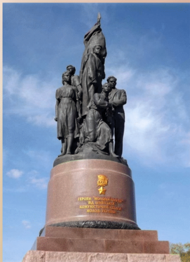
Памятник героям молодого гвардейцам в Краснодоне

А память о Великой Победе отложите свои дела, прочитайте хорошую книгу о войне.