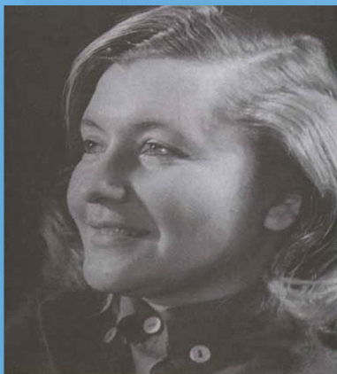
Юлия Друнина 10 мая 1924 г. – 20 ноября 1991 г.

Я ушла из детства в грязную теплушку, В эшелон пехоты, в санитарный взвод. Дальние разрывы слушал и не слушал Ко всему привыкший 41-й год Ю. Друнина