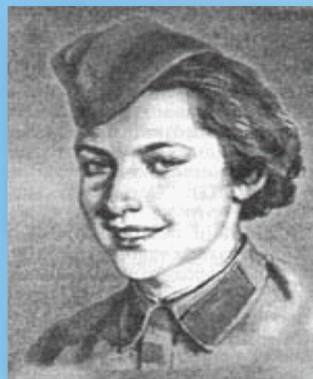
Портрет Ю. Друниной

Юлия Друнина — удивительная поэтесса, талант которой позволил ей очень просто и метко описывать собственные переживания, ужасы военного времени и, конечно, романтические отношения. Строки стихов Юлии Друниной оказались настолько близки каждому человеку, что до сих пор остаются актуальными. «Баллада о десанте», «Ты — рядом, и все прекрасно», «Зинка», «Осень», «Знаешь» - эти и другие стихотворения по сей день заставляют читателей переживать чувства, которые вложила в них поэтесса.